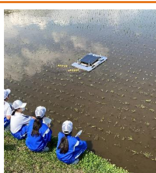
地域の農業教室 有機栽培について学習しました