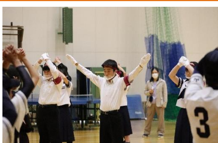
総体激励集会 選手を含めて全校応援で気合いを入れました。吹奏楽部の演奏で入退場をしました。