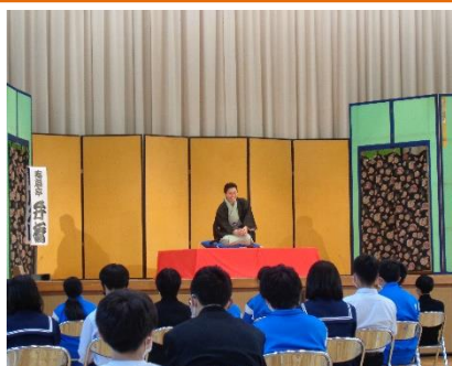
武川中と合同芸術鑑賞教室(落語)