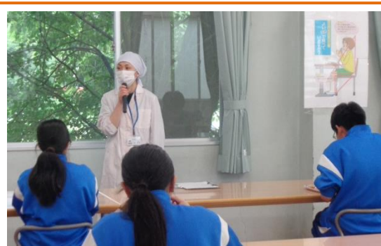
食育 食べるときの姿勢について栄養教諭から指導を受けました