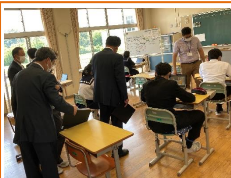
北杜市教育委員学校訪問 各学年の授業を参観していただきました